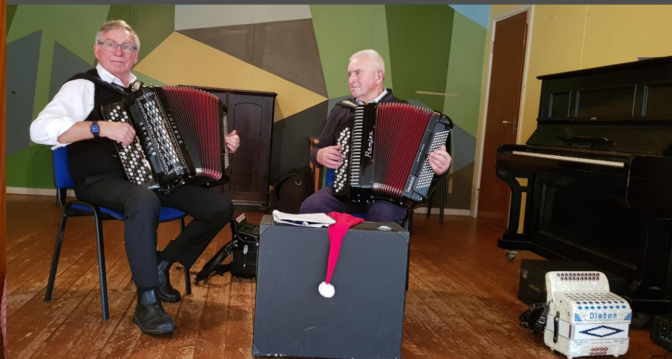
Som bjöd upp till dans runt granen