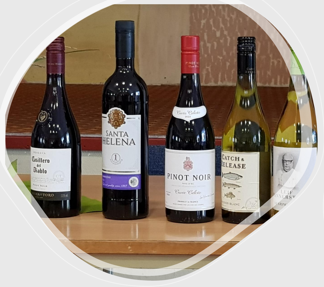
Karin med dagens vinster i lotteriet