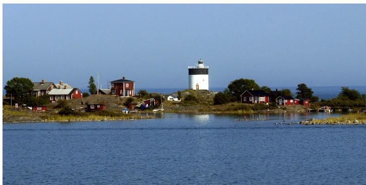
Utsikt från lotsstationen

Samåk gärna . Parkering vid lotsbåtarna vid sjön