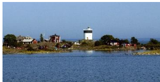
Utsikt från lotsstationen

Samåk gärna . Parkering vid lotsbåtarna vid sjön