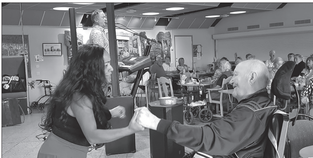
Sommarträff på Solbringan 23 augusti, "Tillsammans mot ensamheten".