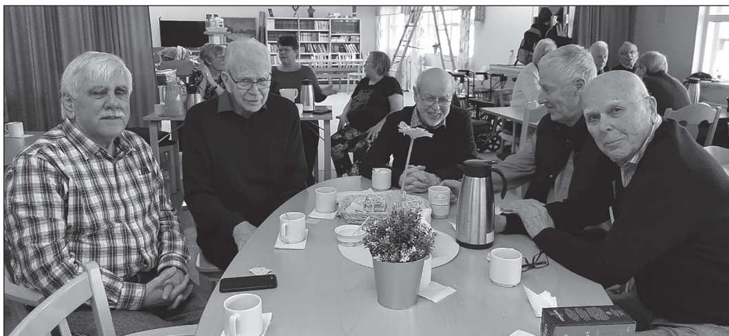
Månadsmöte 7 mars på Solbringan. Kul med så många herrar runt fikabordet.