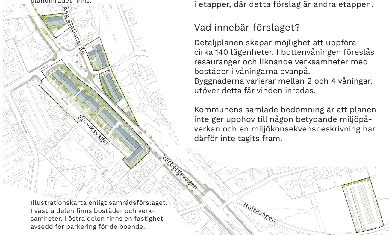
Illustrationskarta enligt samrådsförslaget. I västra delen finns bostäder och verksamheter. I östra delen finns en fastighet avsedd för parkering för de boende.

Kommunens samlade bedömning är att planen inte ger upphov till någon betydande miljöpåverkan och en miljökonsekvensbeskrivning har därför inte tagits fram.