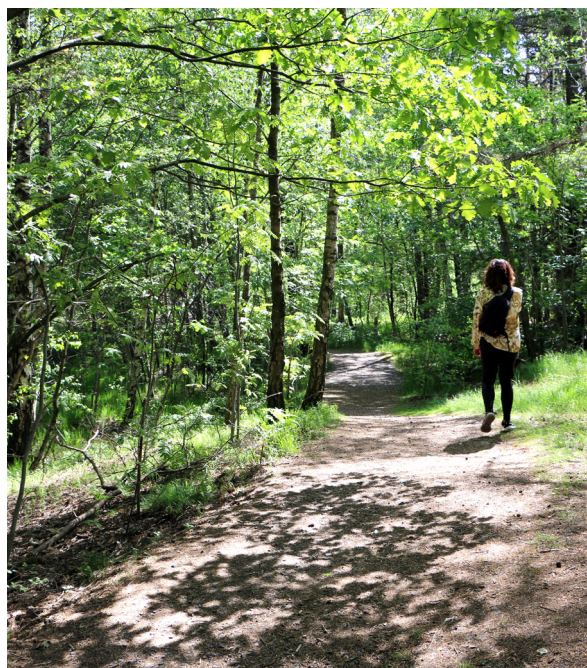
Hitta lugnet med Mindfulness i naturen.