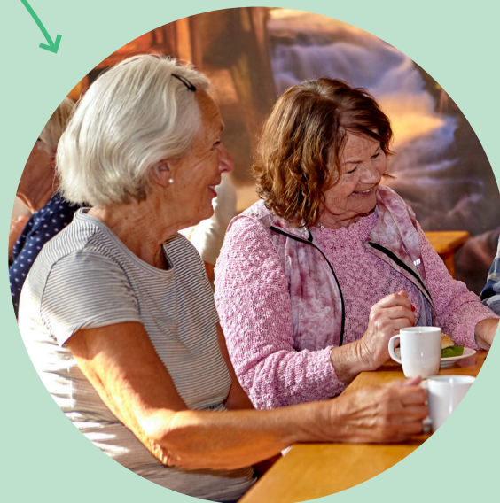
Tankenötter och klurigheter. Kom och ha trevligt tillsammans!

Plats: Apelgårdens kyrka, Knäckepilsvägen 32