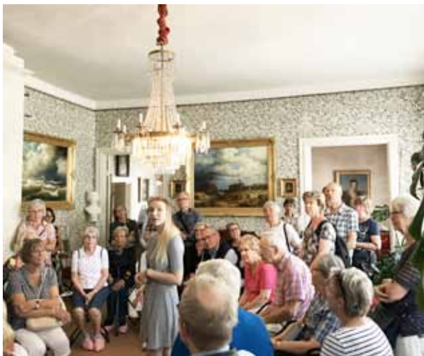
En samling av SPF:are från Åkersberga i norr till Lidingö i söder fick en guidad visning i Johan Ludvig Runebergs hem. Ett tiotal medlemmar från Tibbleseniörerna deltog.

Sibelius var mycket känslig för ljud och det var först efter hans död som fru Aino fick dra in rinnande vatten