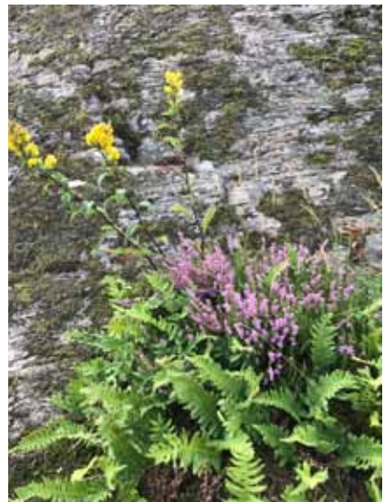
Text och foto: Gunilla Rönnholm