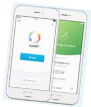
Swisha enkelt och snabbt.

hantera Swish kommer du att uppskatta enkelheten. Det går till exempel att betala deltagavgiften på Tibblese-niorernas månadsmöte via Swish.