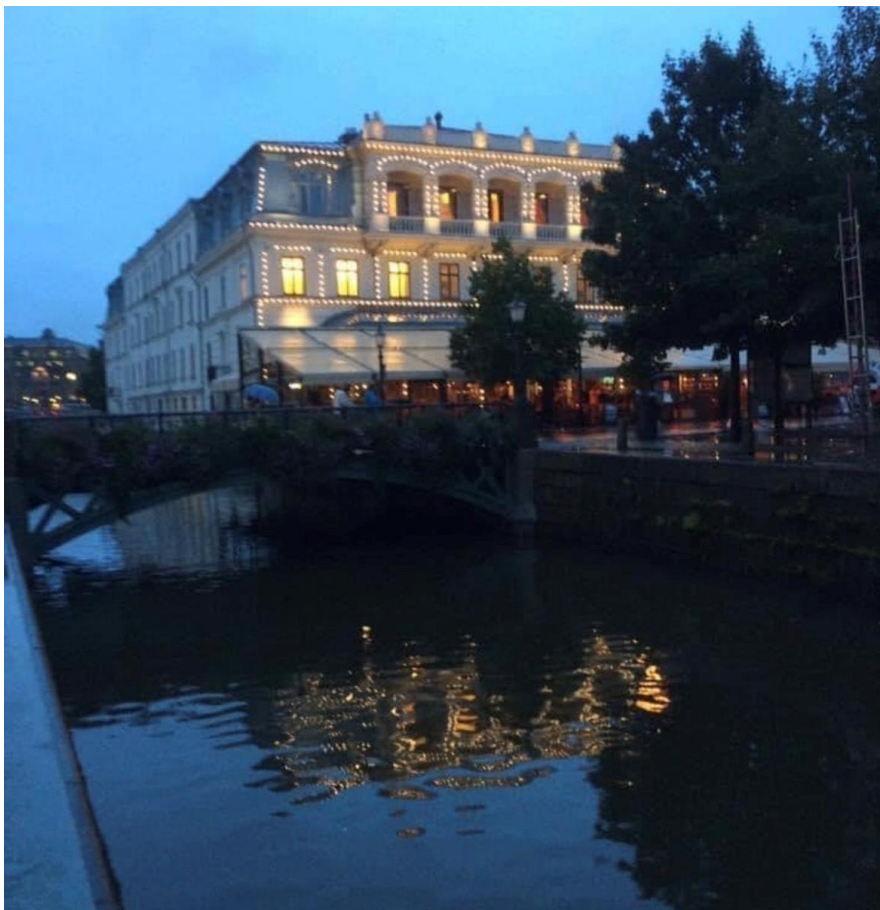
Mötesplats After Work