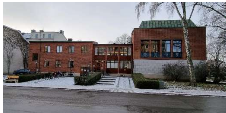
Träffpunkten, Storgatan 11

SPF Senioreerna bildades 1939 och är en ideell, partipolitiskt och i religiösa frågor obunden organisation. Det är den äldsta och näst största pensionärsorganisationen i landet.